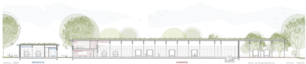
Längsschnitt – durch Fahrzeughalle und Versammlungsräume