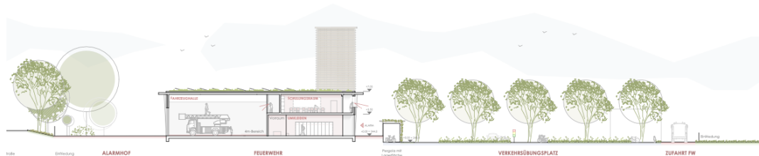
Querschnitt – durch Fahrzeughalle und Versammlungsräume